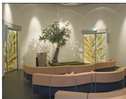
De kleine aula werd door een familielid een keer benoemd als "Het beloofde land"